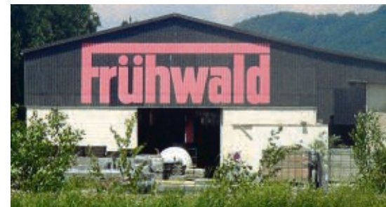
Die Frühwald-Holding ist insolvent – die ebenfalls in Tillmitsch ansässige Frühwald Außenanlagen GmbH ist nicht betroffen

tes Know-how von der Forschung bis zur Industrie“, wirbt Wirtschaftslandesrat Christian Buchmann. Sensorik und Elektronik ermöglichen eine möglichst flüssige Verkehrsabwicklung durch Leitsysteme, Tempomaten und intelligente Antriebstechnologie (Hybrid, Elektro, Wasserstoff), um die Emissionen gering zu halten. Und das „digitale Gen“ des Führerscheinnachwuchses, bei dem die permanente Vernetzung via Smartphone zur Normalität zählt. Was noch fehlt, ist eine entsprechende Teststrecke. Während es in England, Schweden und Frankreich bereits entsprechende Straßenabschnitte gibt und Deutschland noch heuer nachziehen will, hat sich die Steiermark zwar als Testregion beworben. Eine Entscheidung fehlt aber noch. Die Regierungsumbildung kam dazwischen.